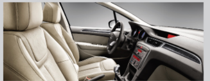
雅致格调灵动真皮内饰