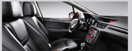
魅黑酷感灵动真皮内饰