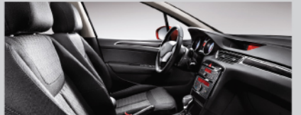
魅黑酷感灵动织物内饰